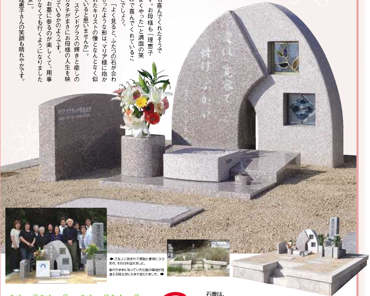
◀ご友人に囲まれて感謝と愛情につつまれ、その日を迎えました。 崩れたままになっていた以前の墓地が見違える程立派に生まれ変わりました。▶

Original Stone Garden オリジナル ストーン ガーデン いしとよ