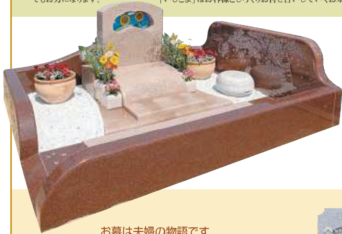
お墓は夫婦の物語です

供養の形ですか？ 慰霊や追悼、記録のためでしょうか。あるいは世間体や習慣、義務だからと思われませんか。もちろん、それらの意味もあるでしょう。しかし、「いしとよ」は、追憶や感謝の気持ち、絆や愛の証、そして残された者の癒し…という「想い」が人切だと考えます。それは、「夫婦の愛の絆」であったり、「生きて証」であったり、「家族への贈り物」であったり…、「想い」の数だけ「家族の物語」があるのです。「いしとよ」ではそんな「家族の物語」をカタチにするお手伝いをいたします。お墓は値段だけで適当に決めるものではありません。簡単に建て替えるものでもありません。だからこそです。大切な「想い」をじっくり、じっくりお聞かせください。そして安心できるまで、しっかりお尋ねください。また納得できるまで、とことんご相談ください。「いしとよ」はお墓のことなら何でもお力になります。「いしとよ」はお客様とじっくりお付き合いしていくお墓の専門店です。