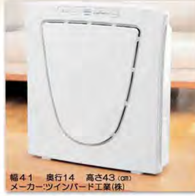
幅41 奥行14 高さ43 (cm) メーカー: ツインバード工業(株)